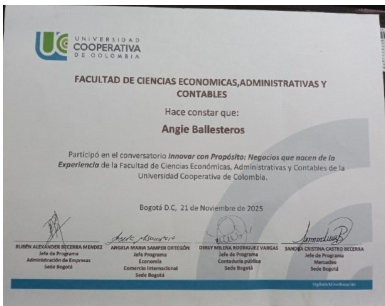
Participación en espacios académicos universitarios promoviendo el emprendimiento con propósito

La organización continuará fortaleciendo su aporte social mediante la ampliación de espacios educativos, la generación de alianzas con instituciones académicas y la promoción de iniciativas que contribuyan al desarrollo de nuevas generaciones de emprendedores comprometidos con el impacto positivo.