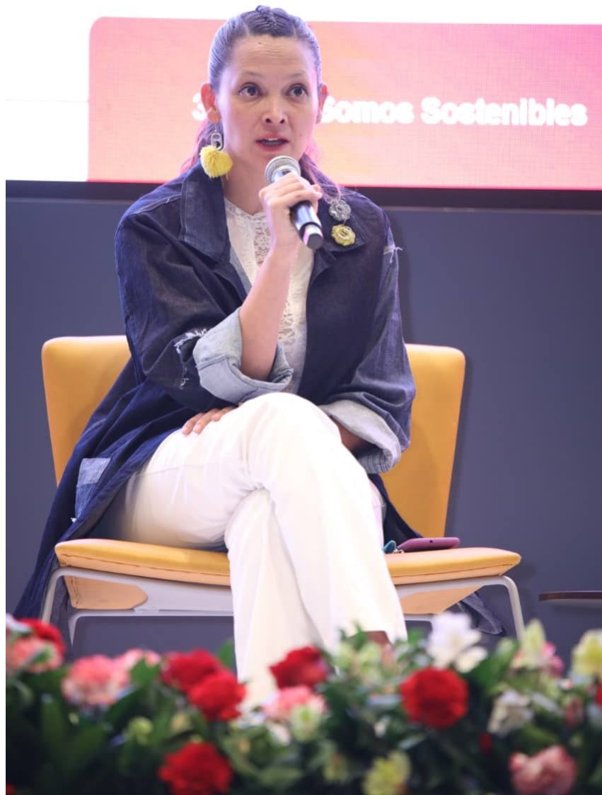
Figura 1 Participación como panelista y expositora en la Cumbre Internacional de Sostenibilidad e Innovación

Durante el año 2025 se registraron ingresos aproximados por seis millones de pesos, resultado de las ventas realizadas a través de ferias, eventos, canales digitales y otras actividades comerciales. Más allá de los resultados económicos, la organización concentró importantes esfuerzos en innovación, posicionamiento de marca, validación de nuevos materiales y exploración de oportunidades internacionales que contribuirán al crecimiento futuro de la empresa.